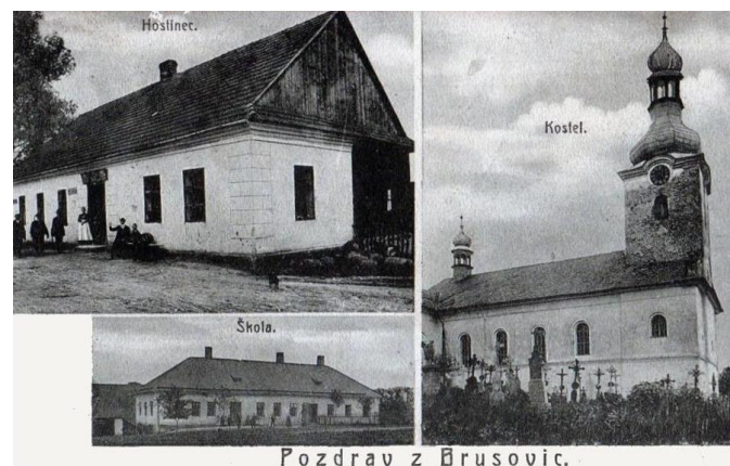
Nahlédnutí do bohaté historie Bruzovic ..