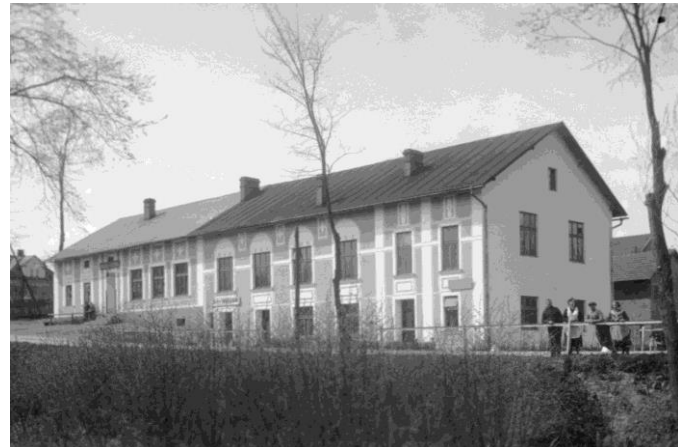
Byla to pěkná budova ...

* Rozbor vody a půdy Vám může provést i místní akreditovaná laboratoř: Laboratoř MORAVA s.r.o., tel.: 558653172