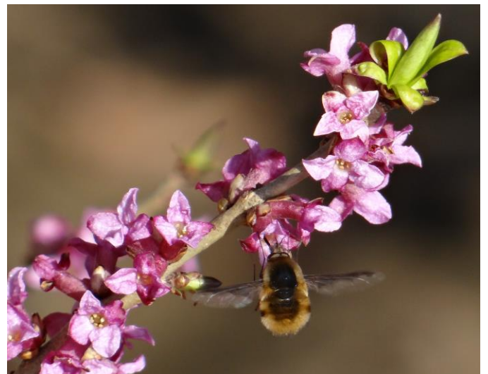
Vzácný Lýkovec obecný (jedovatý) právě kvete. Snímek je z volné přírody (les) v Bruzovicích, ne ze zahrady...

* Vyhlášku zatím nemáme, ale upozorňujeme na přerušeni činností jako je kosení trávy, řezání dřeva, provoz podnikatelských provozoven v zóně smíšeně-obytné v době svátků, v neděli a v sobotu večer. Je to čas, kdy většina občanů po náročném týdnu raději přijme klid a odpočinek.