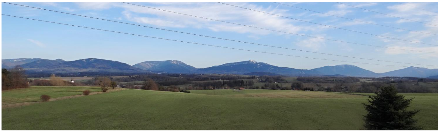
Beskydy z Bruzovic