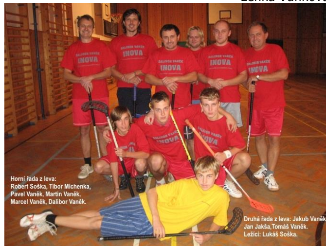
SK Bruzovice, oddíl florbalu

Sociální a Finanční poradna sjedná slevy pro mladé rodiny s dětmi, sociálně slabší skupiny obyvatel, seniory, pro držitele průkazů TP, ZTP a ZTP-P na elektrickou energii u vybraného dodavatele, na benzin a naftu v síti vybraných čerpacích stanic, na služby vybraného mobilního operátora (slevy 30-40%), pevné linky, internet, pevnou telefonní linku, pojištění, na dodávku plynu, na právní, sociální, daňové a psychologické služby pro všechny občany. Kontaktní místo: Dům odborových služeb, Českobratrská 18, Ostrava. Úřední den: každý čtvrtek 9.00 – 12.00 hod., tel. 596 111 023, 605 082 265.